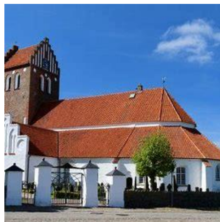
St. Marien-Kirche zu Båstad