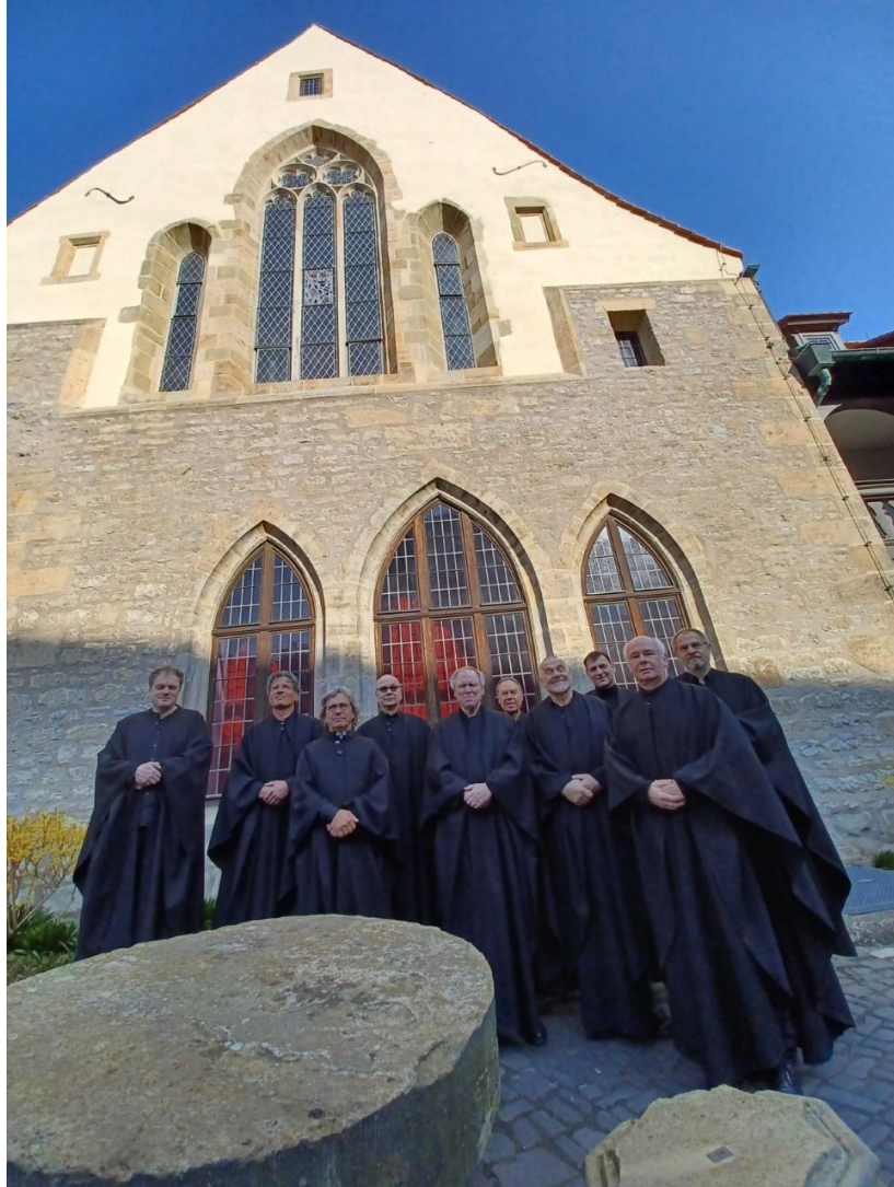
Einige der Georgsbrüder beim Frühjahrskonvent in Luthers Kloster in Erfurt, 2022