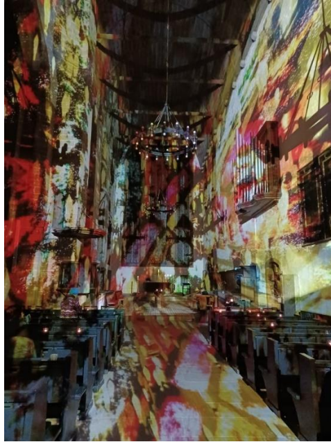
Lichtinstallation in der Erfurter Augustinerklosterkirche

Gott, lass meine Gedanken sammeln zu dir. Bei dir ist Licht, du vergisst uns nicht. Bei dir gibt es Hilfe, bei dir gibt es Geduld. Ich verstehe deine Wege nicht, aber du weisst den Weg für mich. Amen.