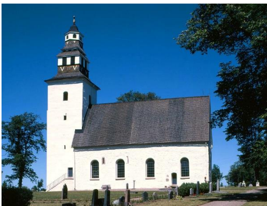
Kirche von Hov

Bitte melden Sie sich an, um sich einen Platz zu sichern.