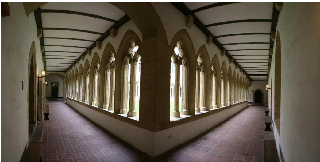
Kreuzgang im Ev. Augustinerkloster Erfurt, wo Martin Luther von 1505 bis 1510 als Mönch gelebt hat

22.00 Uhr Komplet (Nachtgebet der Evangelischen Bruderschaft St.Georgs-Orden (SGO) Jeder ist herzlich eingeladen, an allen Gottesdiensten und Stundengebeten teilzunehmen.